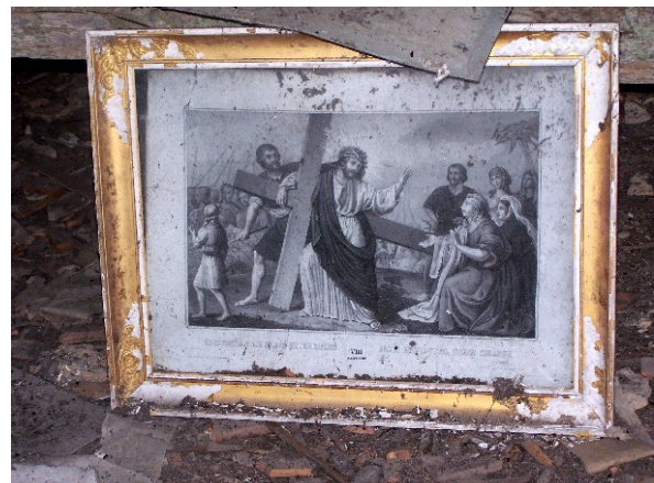
Une des stations de l'ancien chemin de Croix