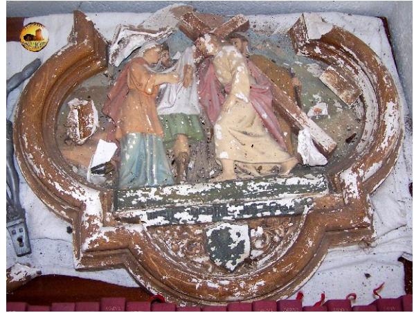
La station 6 détériorée n'est pas appendue au mur mais rangée dans la sacristie.